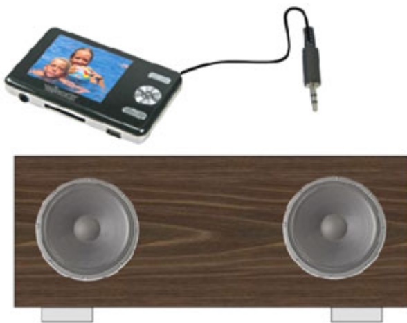
Construct an amplified speaker for your MP3 player