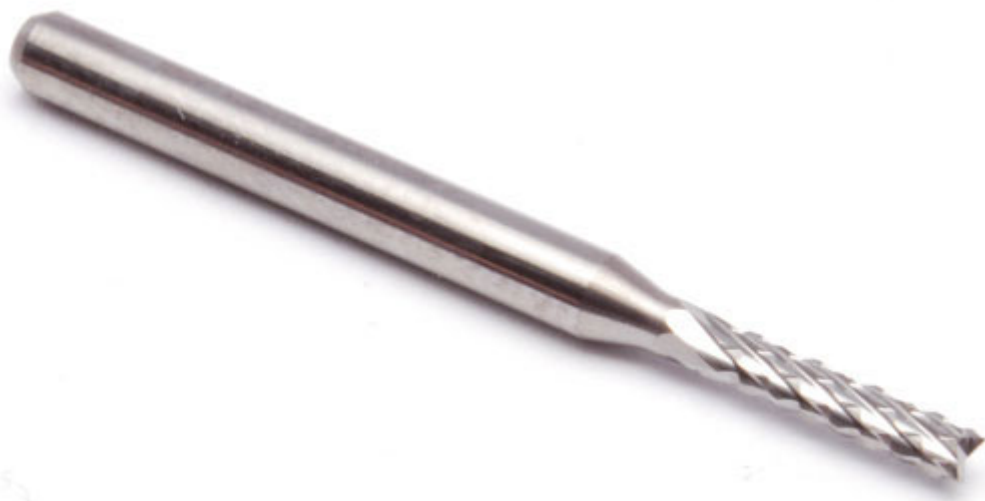
IMMAGINE IN DETTAGLIO

Fresa ad alta velocità in metallo duro adatta per lavorazioni di materiali a base di fibra di vetro, compensati o per la lavorazione dei circuiti stampati. Ottima nelle lavorazioni interne e esterne. Lunghezza fresa: 38,1 mm, lunghezza tagliente: 14 mm, diametro gambo: 3,175 mm.