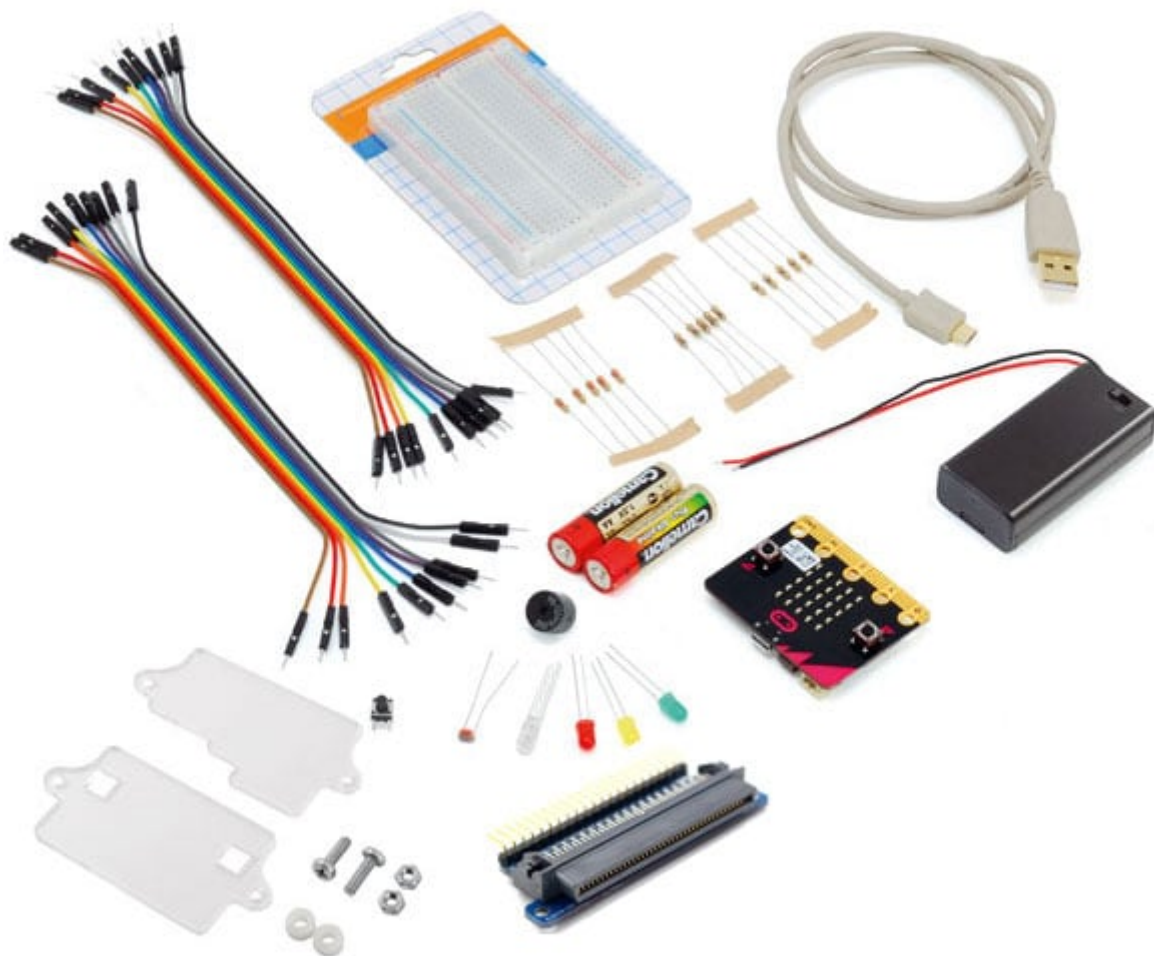
micro:bit con il case trasparente contenuto nel kit