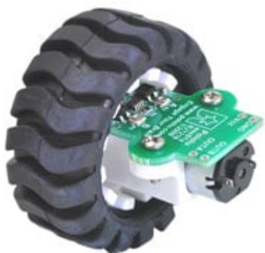
Encoder per ruota Pololu 42 x 19 millimetri (la foto mostra l'encoder, la ruota, il motore e il supporto) (codice prodotto 7300-ENCODERW4219 )