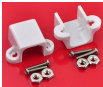
coppia di supporti (versione più lunga) con viti e dadi in dotazione per il montaggio del micro motoriduttore MMG298 e dell'Encoderw4219 (codice prodotto 7300-MMGSUPP1 )