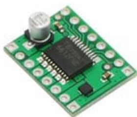
Micro driver per 2 motori DC (codice prodotto 7300-TB6612FNG )