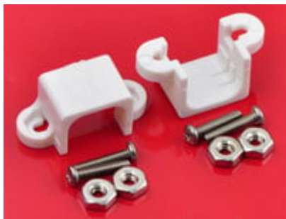
coppia di supporti con viti e dadi in dotazione per il montaggio del micro motoriduttore in metallo MMG298 (codice prodotto 7300-MMGSUPP )