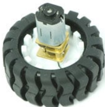
Ruota Pololu 42x19mm con MMG298 (codice prodotto 7300-RP4219 )