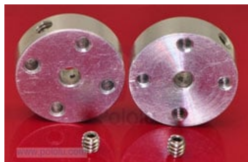
Mozzo 3 mm per accoppiamento asse motore e ruota (codice prodotto 7300- HUB3MM )