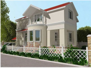
Case e condomini