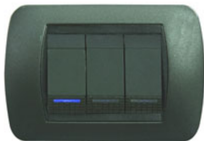
Shown with BTicino® push buttons

Set composto da 5 indicatori a LED color blu, montati su un piccolo PCB, completi di cavetto e alimentati a 12 Vdc attraverso il modulo pulsanti ad 8 canali per sistemi VELBUS codice 8220-VMB8PB o 8220-VMB8PBU. Utili come segnalatori luminosi per pulsanti della Bticino® della serie Living®, Light® & Light-Tech®. Attenzione! non alimentare direttamente a 220 Vac.