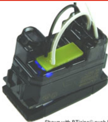
Shown with BTicino® push button