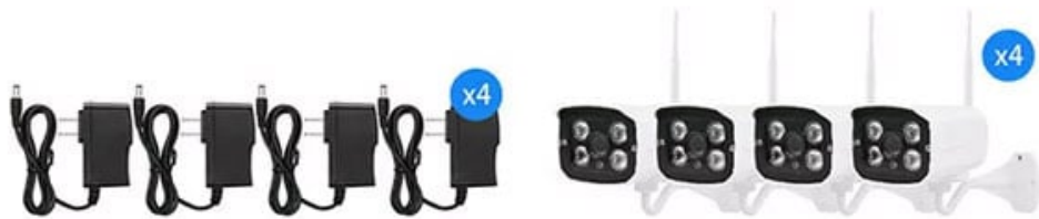
Power Supply Camera