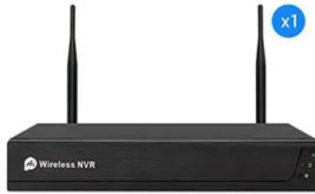
Network Video Recorder