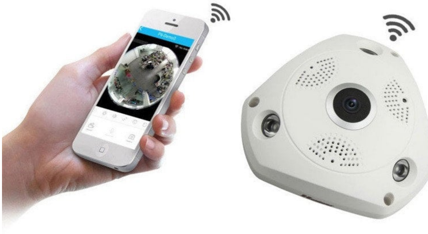
Ripresa della telecamera dall'alto

FishEye 2 Mpx IR Ottica Fissa – Motion detection – Wireless, Ethernet Telecamera con ottica fissa FishEye ripresa grandangolare a 360°. Dispone di sensore di movimento con notifica push d'allarme su smartphone, di altoparlante e microfono incorporato a 2 vie per parlare ed essere ascoltati da remoto. È dotata di ottica fissa da 1.44 mm e di 3 LED IR che permettono di riprendere immagini perfette anche in condizioni di scarsa luminosità. Supporta la visione da remoto tramite smartphone con sistemi Android. È possibile registrare i video sulla memoria dello smartphone tramite apposita APP, oppure su micro SD Card (max. 128GB – non compresa). Formato di compressione video H.265 dual stream. L'immagine ripresa può essere ruotata tramite l'APP e può essere suddivisa in tre riquadri separati, come se le telecamere impiegate fossero tre. Dispone di filtro IR-Cut progettato per rendere migliori i contrasti e la qualità dei colori delle immagini rendendole più naturali. La telecamera può essere utilizzata all'interno sia di reti wireless che cablate. Alimentazione 12 Vdc, tramite adattatore di rete. Fornita completa di viti e tasselli per l'installazione a parete e di manuale d'installazione in italiano.