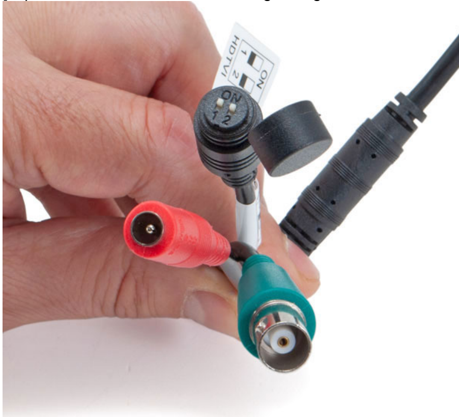
Plug di alimentazione telecamera, BNC femmina segnale video, e Dip-Switch per la configurazione dello standard del segnale video.[/caption] [caption id="attachment_118880" align="aligncenter" width="400"]