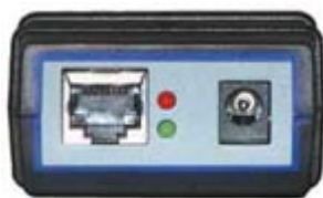
Porta Ethernet 10BaseT Plug di alimentazione