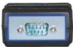
Porta seriale RS232