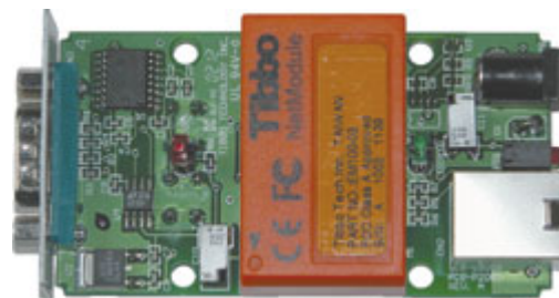
Vista interna del Serial Device Server DS100R II Il cuore del dispositivo è il modulo EM100