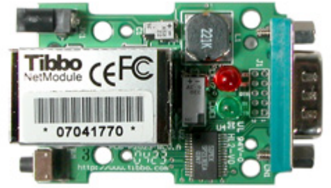
Vista interna del Serial Device Server DS202R Il cuore del dispositivo è il modulo EM202EV

Il DS202R realizza un "Server di Periferiche Seriali"; consente cioè di collegare qualsiasi periferica con uscita in formato RS232 ad una LAN di tipo Ethernet. La comunicazione con la periferica può avvenire da qualsiasi PC collegato alla rete locale; in più, se quest'ultima dispone di una connessione verso Internet, il dispositivo seriale può diventare accessibile anche da qualsiasi computer esterno. In questo modo è possibile posizionare la periferica dove più ci aggrada, collegarla al DS202R e collegare quest'ultimo all'hub della LAN, utilizzando cavi che secondo le specifiche possono arrivare anche a 100 metri di lunghezza. Il DS202R è munito di una porta 10/100BaseT per connettersi alla LAN ad una velocità di 100Mbit/s e di una porta universale RS232 per collegarsi alla periferica. Dispone di un power jack per l'alimentazione (compresa tra 10-25VDC) e di alcuni led per indicare lo stato del dispositivo o della connessione Ethernet. Inoltre viene fornito con i driver per il corretto funzionamento in ambiente Windows e alcuni software di gestione e di programmazione.