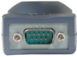
Porta seriale universale (RS232)