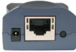
Porta Ethernet 10/100BaseT Plug di alimentazione